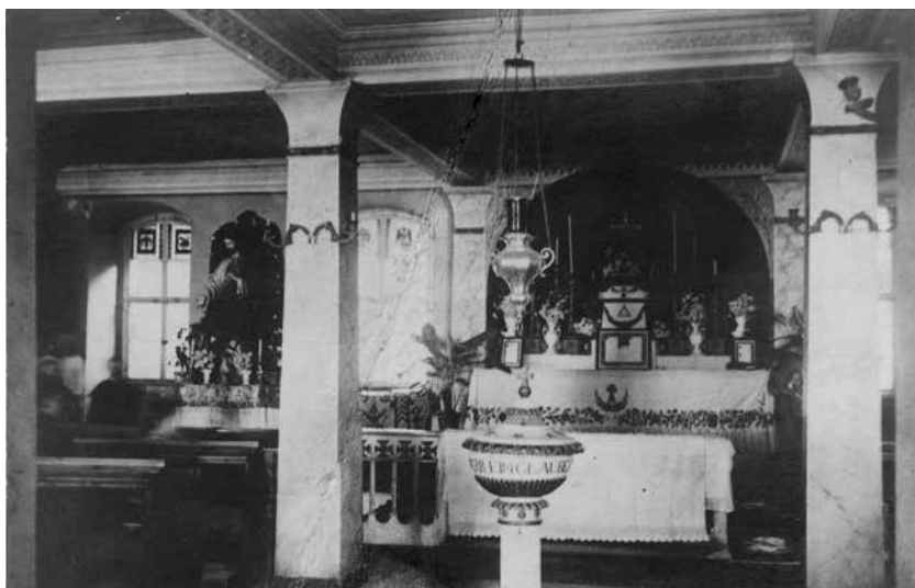
Katholische Kapelle im Torhaus des Großen Jägerhauses, Weimar, Marienstraße, o. D.