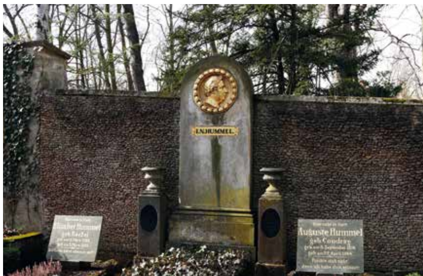
Familiengrabstätte Hummel auf dem Historischen Friedhof in Weimar.